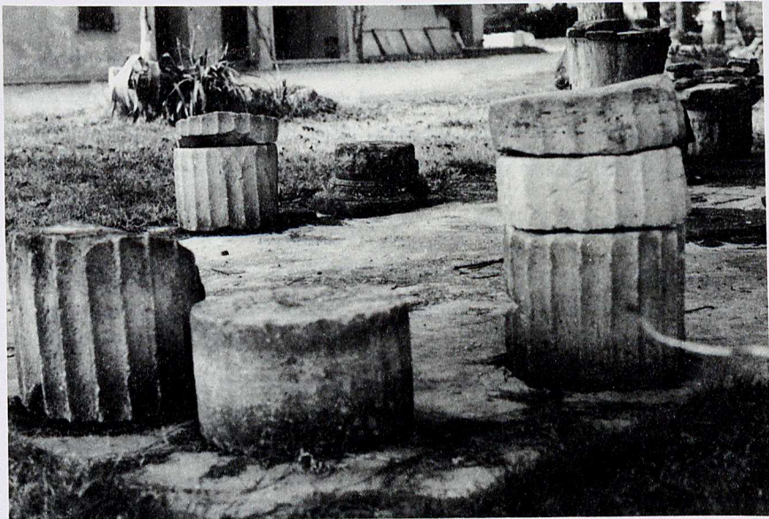
Fig. 3 - Capitelli e rocchi di colonne romane da Crocifisso di Roncosambaccio.