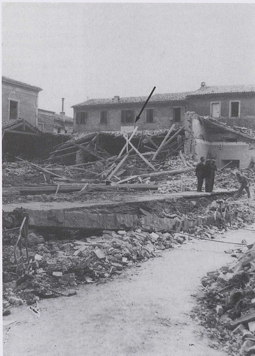
La casa natale di Giulio Grimaldi con la lapide sulla facciata (indicata dalla freccia) in una fotografia scattata subito dopo il bombardamento del 17 aprile 1944