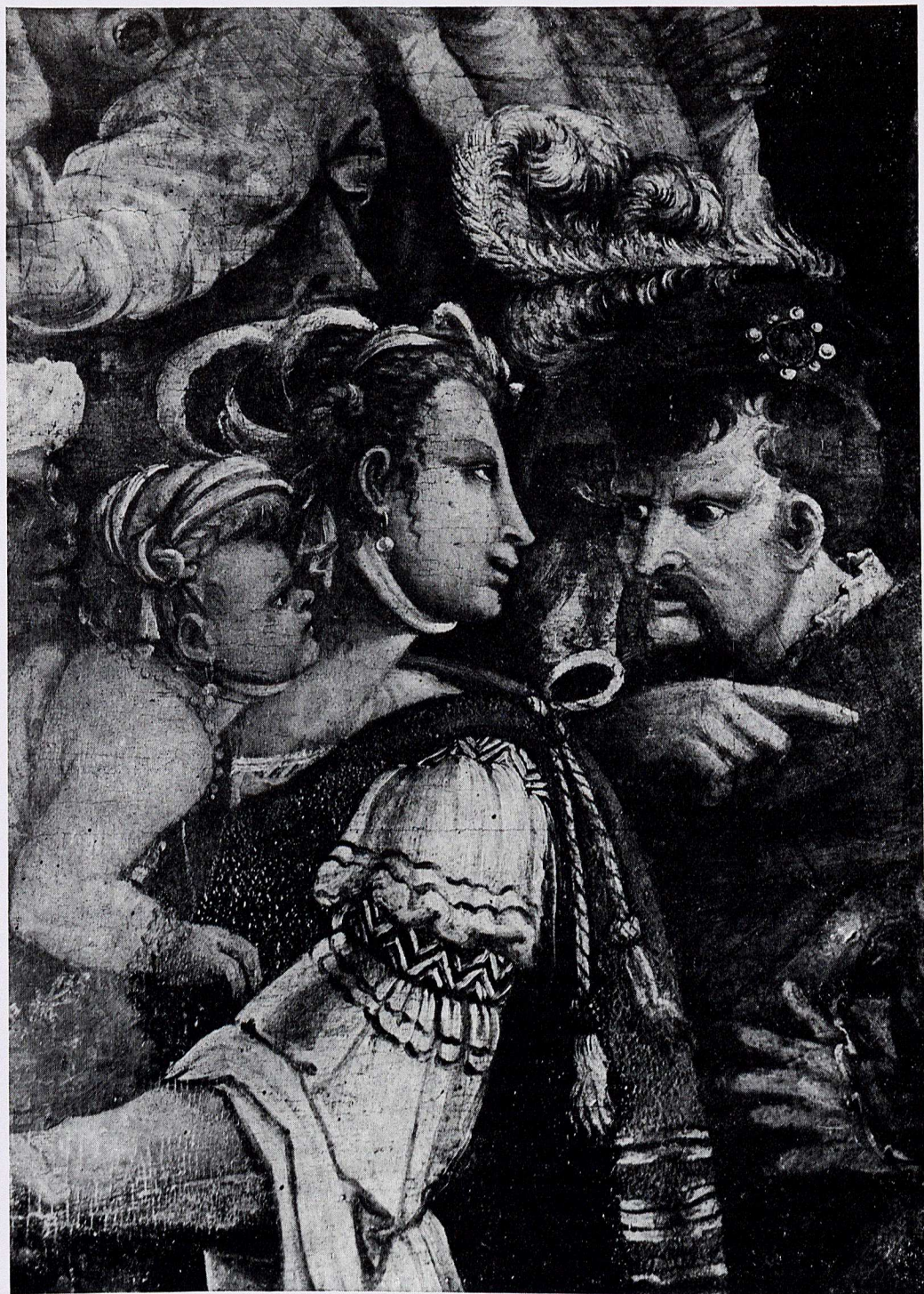
Bartolomeo e Pompeo Morganti, Particolare della Pala di S. Michele ( Museo Civico, Fano )