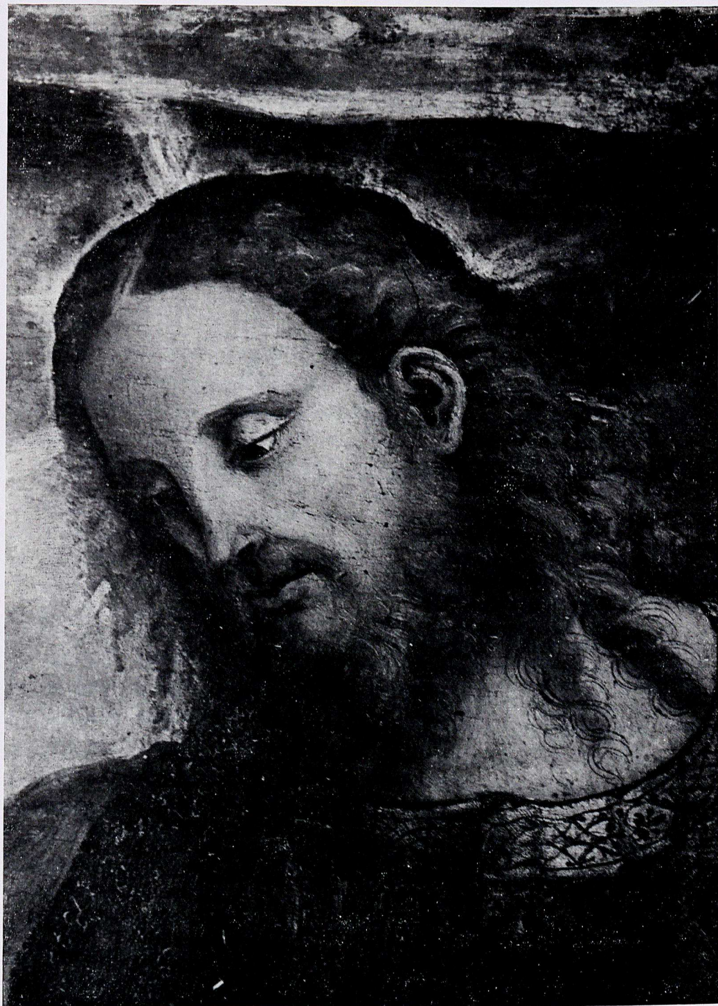
Bartolomeo e Pompeo Morganti, Particolare della Pala di S. Michele ( Museo Civico, Fano )