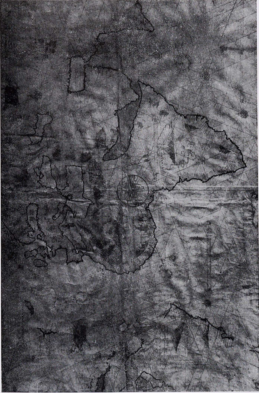
La « Carta da navigare » di V. Maggiolo (secolo XVI) conservata nella « Federiciana » di Fano.