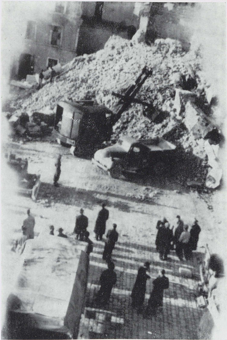
Personale militare, cittadini e automezzi alleati presso le rovine della torre civica