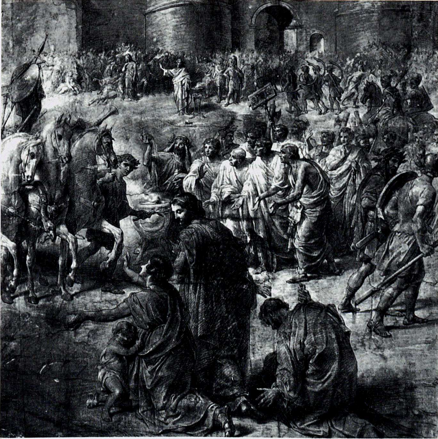
Fig. 3 - Francesco Grandi, Particolare del cartone per il sipario del Teatro della Fortuna (Fano, Pinacoteca Civica).