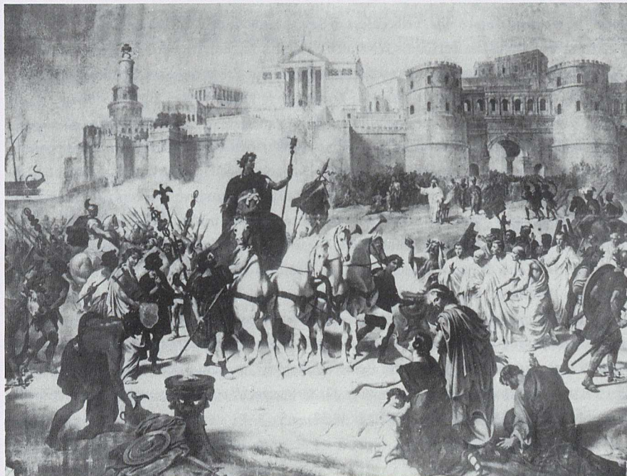
Fig. 2 - Foto d'archivio del sipario o «telone» dipinto da Francesco Grandi per il Teatro della Fortuna (Fano, Biblioteca Federiciana).