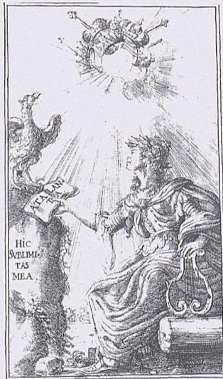
Antiporta e frontespizio del libretto "Artemisia".