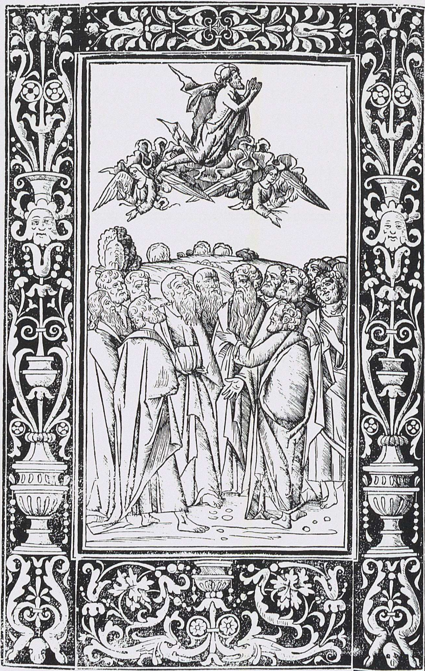
Fig. 5 - Xilografia dal Decachordum christianum di Marco Vigerio (n. 42).